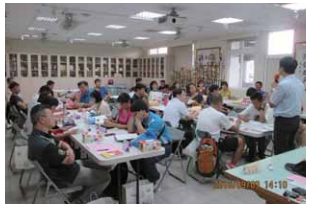
105年第三次板土分區委員會