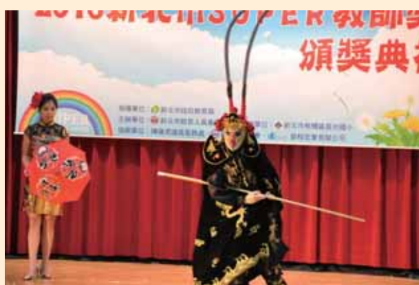
Super 教師頒獎典禮表演活動