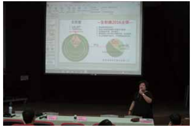
105年第三次文汐瑞分區委員會