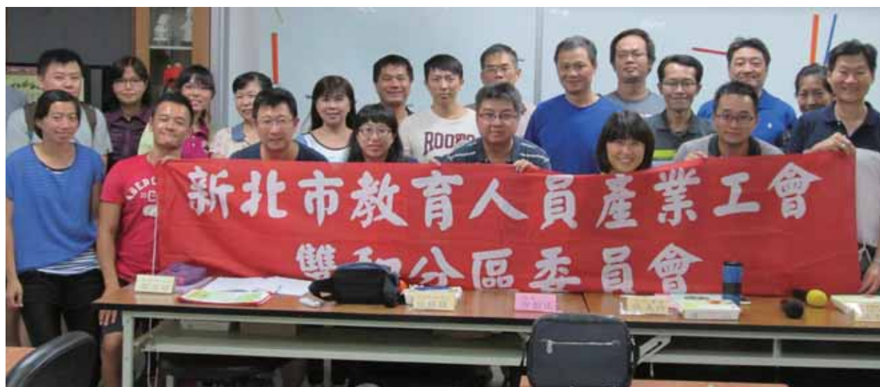
105年第三次雙和分區委員會