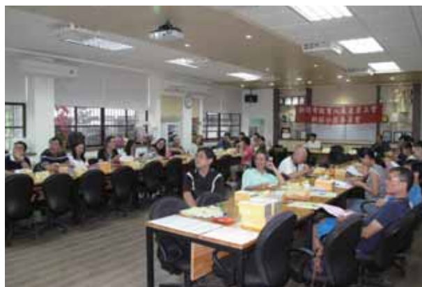
105年第三次新莊分區委員會