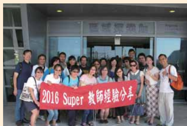
Super 教師經驗分享研習 (海科館場)