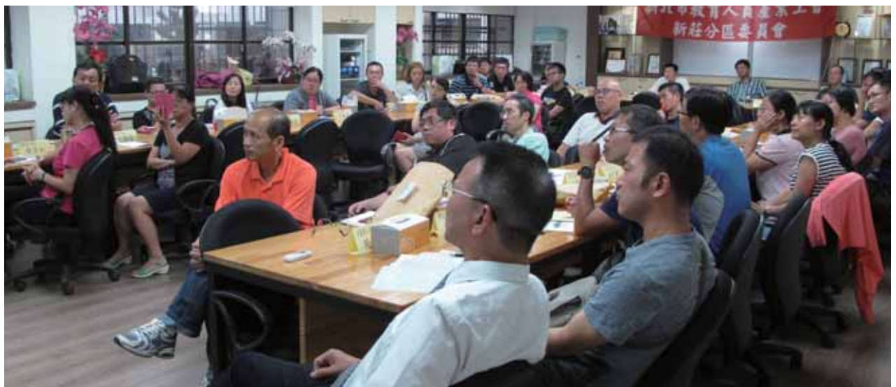
105年第三次新莊分區委員會