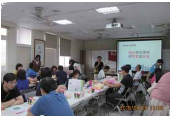
105年第三次板土分區委員會