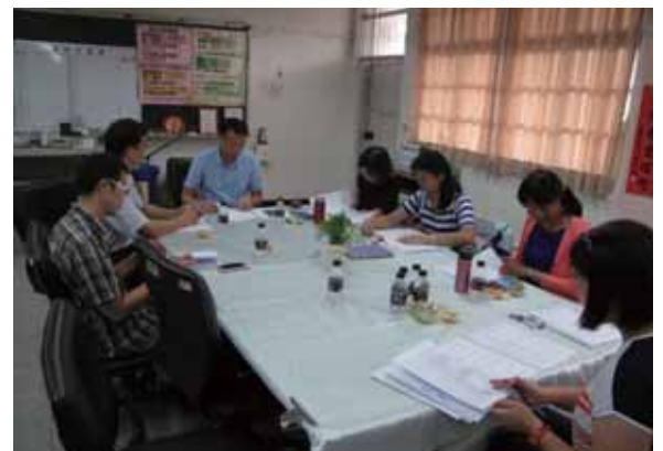
教師會第八屆第 15 次監事會