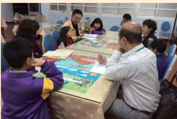
評審委員校園訪視