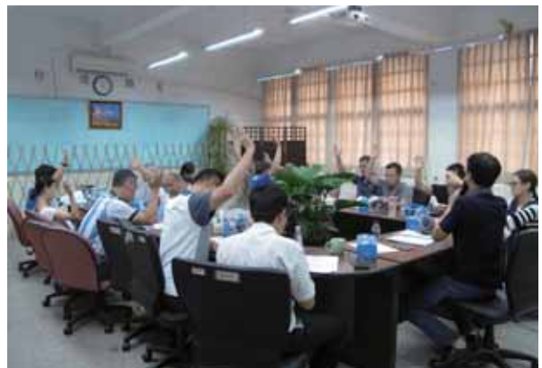
新北市教師會第八屆第五次定期理事會