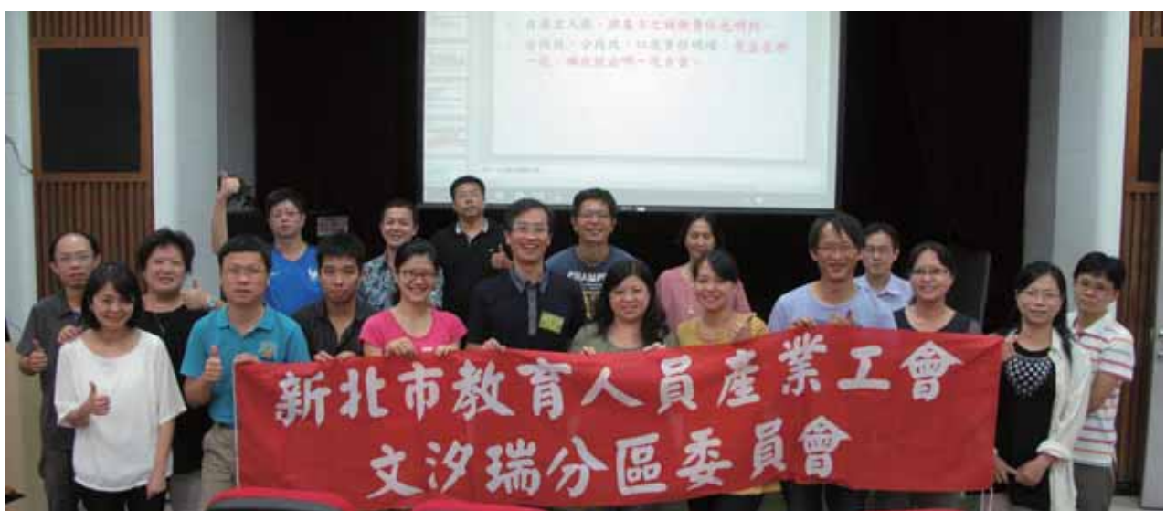
第三次文汐瑞分區委員會