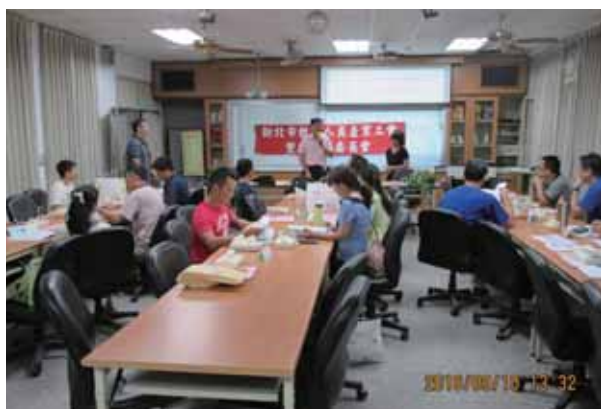
105年第三次雙和分區委員會