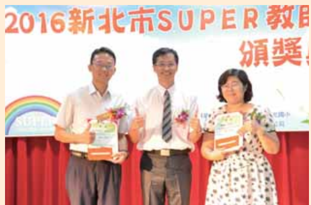
Super 教師網路票選最佳人氣獎