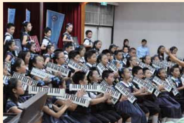
Super 教師頒獎典禮表演活動