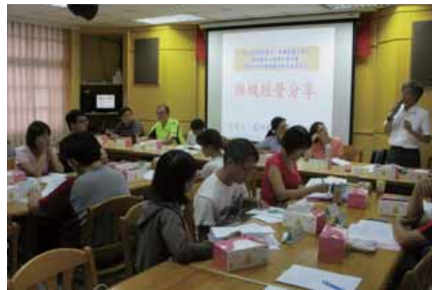
105年第三次重蘆淡分區委員會