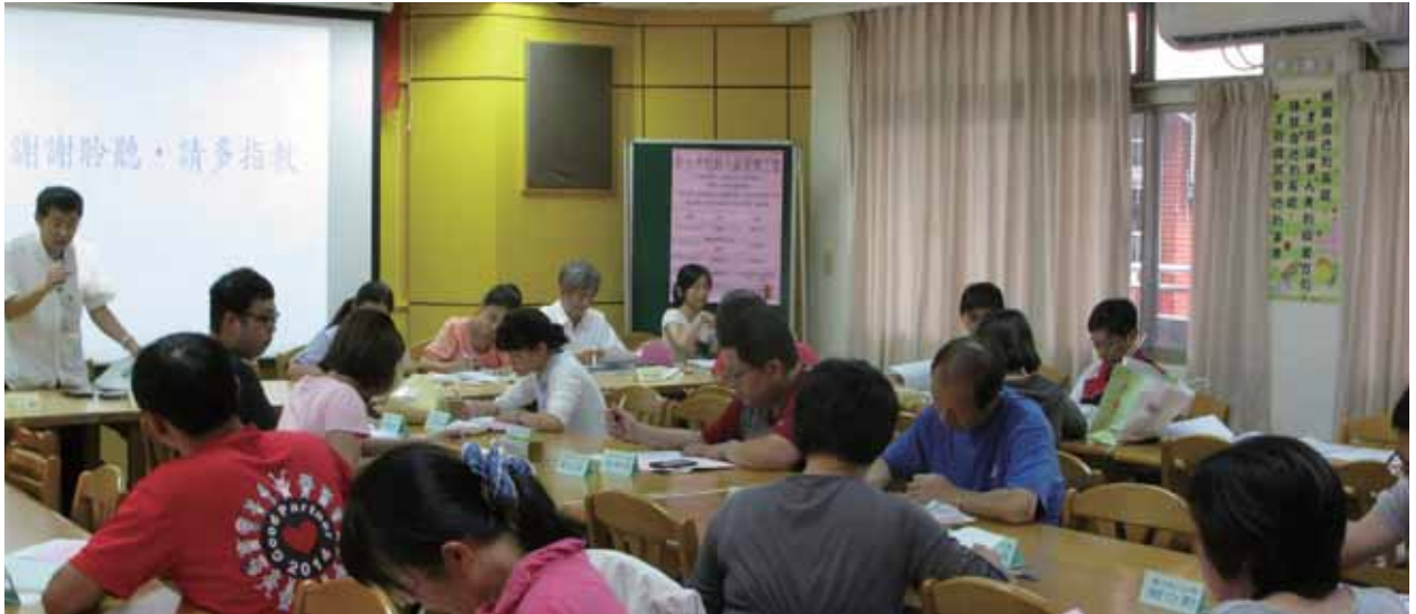
105年第三次重蘆淡分區委員會