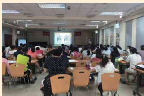
Super 教師經驗分享研習 (網溪國小場)