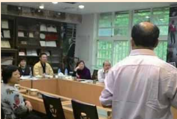
評審委員校園訪視