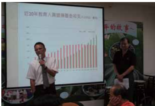
105年第三次新莊分區委員會