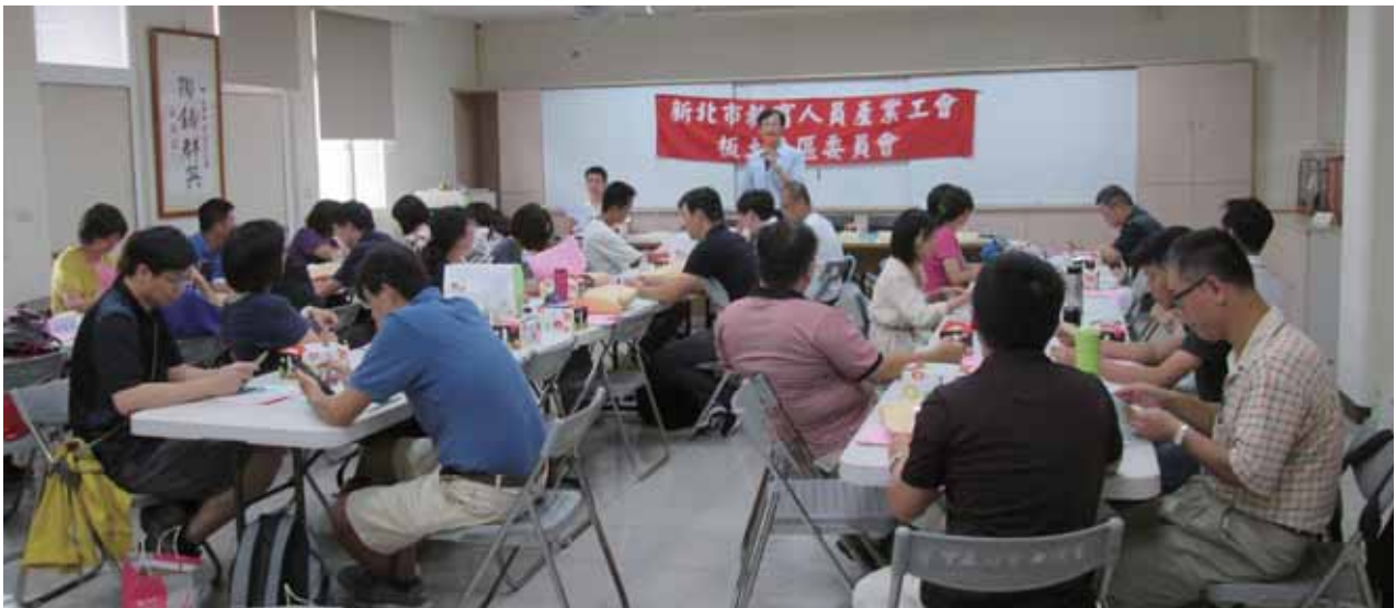
105年第三次板土分區委員會