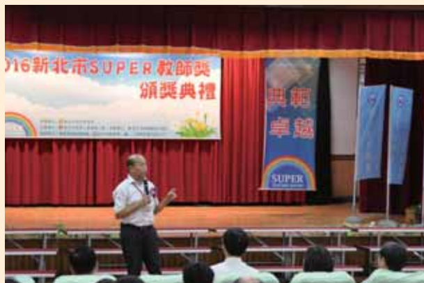
Super 教師頒獎典禮來賓致詞