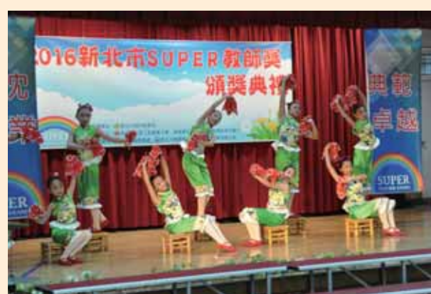
Super 教師頒獎典禮表演活動