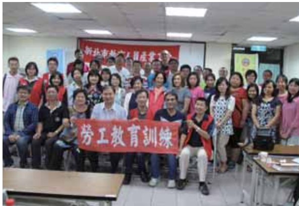
105 年度勞互教育訓練