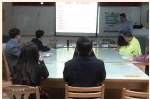
評審委員校園訪視