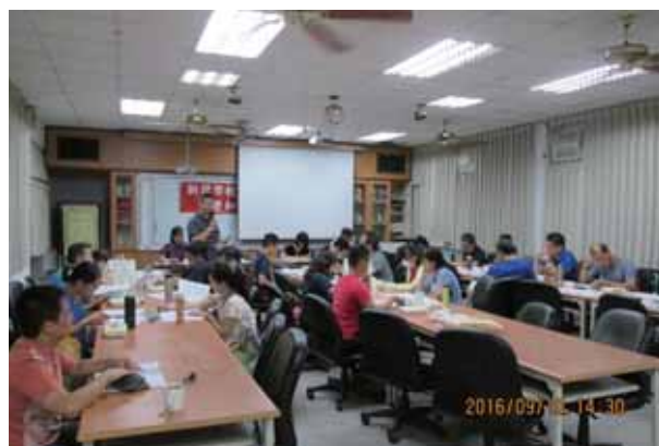
105年第三次雙和分區委員會