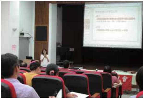
105年第三次文汐瑞分區委員會