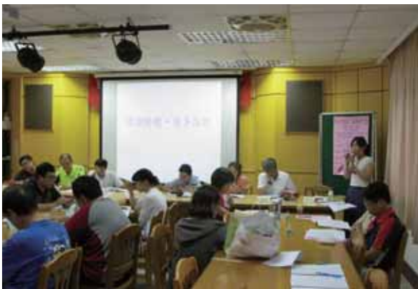
105年第三次重蘆淡分區委員會