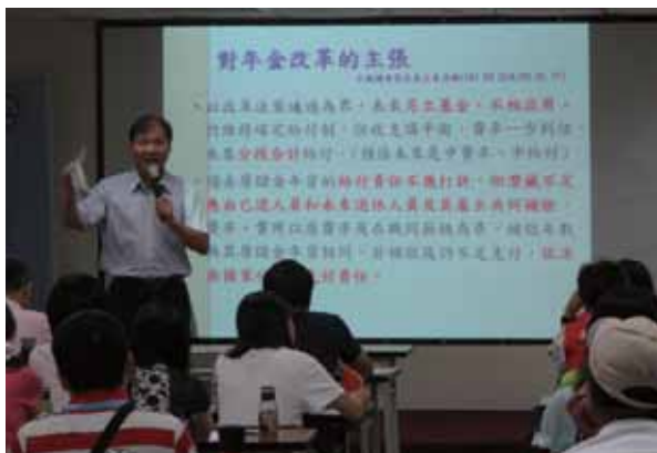
105 年度勞互教育訓練