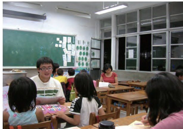
個別督導：教學督導入班觀察，並於課後立即討論與提供建議