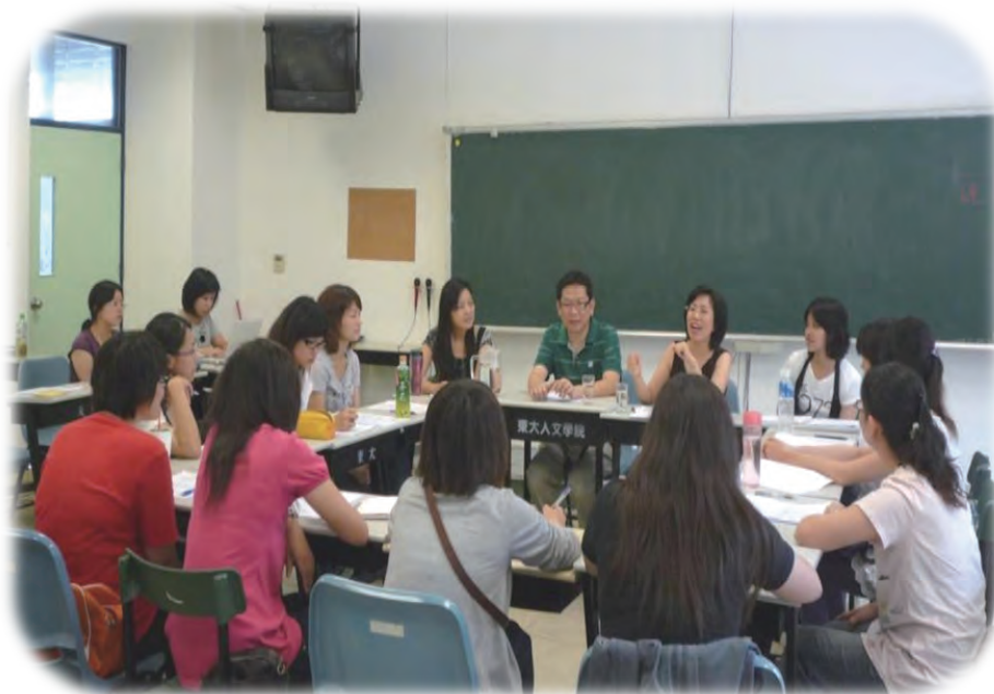
團體督導：針對教學、教材、班級經營及學生行為進行深入的探討

團督因為時間較充裕，除了比較能深入地解決補救教師在教學或行政上遇到的問題外，更重要的是，大家在一起，會有相濡以沫的感覺，同時兼具協助、支持、分享等不同的功能。