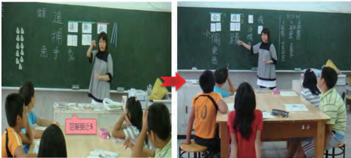
督導前後，調整空間安排，有助於教學流暢且學生上課更專注

節嗎？是的！魔鬼都藏在細節裡，當上課的物理環境不便時，可能會影響到整體的教學效能，例如：「老師上課的動線」，如果講桌擺放的位置不對，可能會影響老師巡堂的動線—不易走動、沒辦法即時處理學生的學習情況等。因此，在督導初期首要處理的就是「物理層次」，且這是最容易被調整的，一旦改變了物理結構，可能因而提升教學的效能。