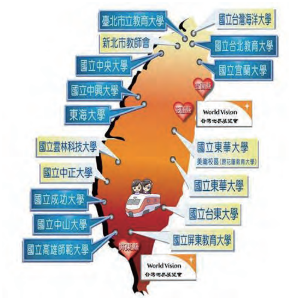
永齡教學督導模式系統用於全國各分校

永齡的補救教室裡，除了有經過實驗驗證有效的補救教學教材、還要有能將教材靈活運用的補救教師，並能透過教學督導模式幫助老師覺察、後設自己的教學，讓教學更精緻化，因此「教學督導」是不可缺少的致勝關鍵！期待未來能透過「教學督導」的形式，提升整體的學習品質，讓我們一同為孩子努力。唯有行動，生命才有希望！